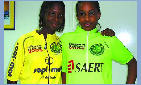
Le maillot sopimat.

Nous avons voulu en savoir plus sur ce sujet et nous commençons ce mois-ci un dossier dédié au rôle de l'acier dans les constructions anti-sismiques et anti-cycloniques. Omniprésent, l'acier l'est encore lorsqu'il s'invite dans le sport dont il épouse si bien les valeurs. Dans le sport comme dans le travail de l'acier, il faut du courage, de l'endurance, de la détermination, de l'audace. Alors quand un collectif de clients crée pour la première fois une manifestation sportive trans-générationnelle autour du VTT et de l'univers de l'acier, c'est tout